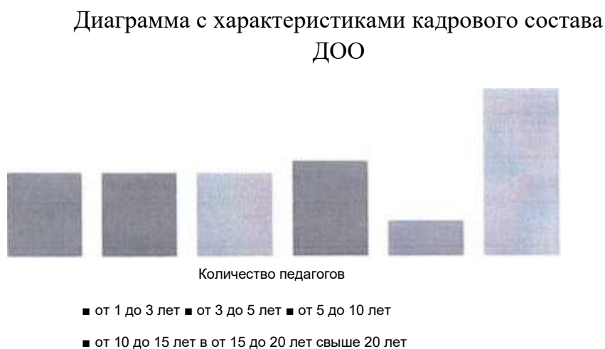
Диаграмма с характеристиками кадрового состава ДОО

Распределение педагогов по педагогическому стажу: